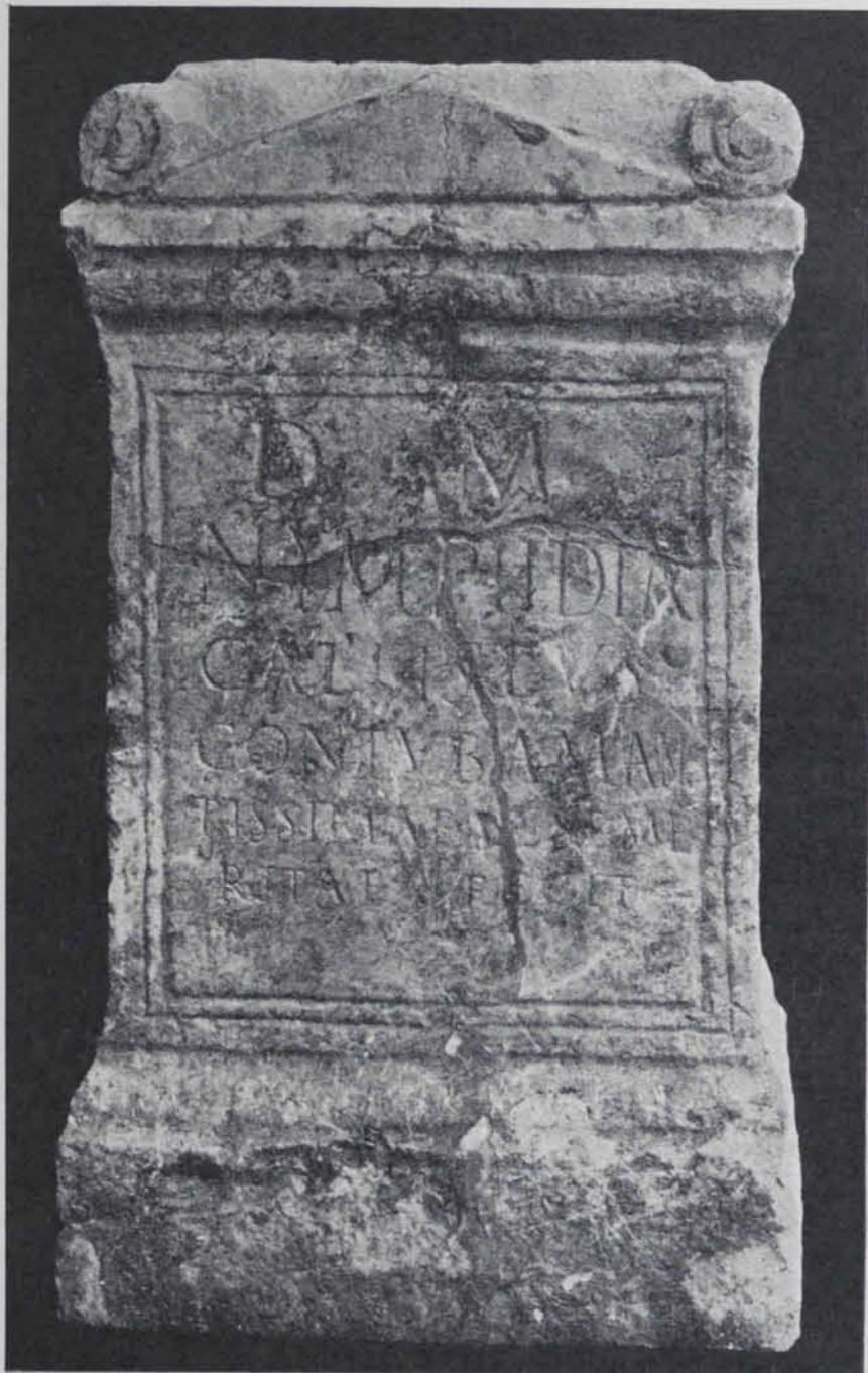
Fig. 359 Tarragona. Cipus de pedra amb inscripció (n.º 32 de P. Beltran)

reproduïda fotogràficament; tampoc la segona (fig. 358) gravada en un dels sepulcres de què ens hem ocupat en el lloc corresponent del present volum de l'ANUARI, reproduïda, en canvi, per J. de C. Serra Ràfols en el seu article Sarcòfags de pedra esculpturats de la necròpolis de Tarragona (1). Quant a la tercera i quarta (figs. 359 i 360) mercès a les reproduccions que en donem hom es farà millor càrrec de llur escriptura.