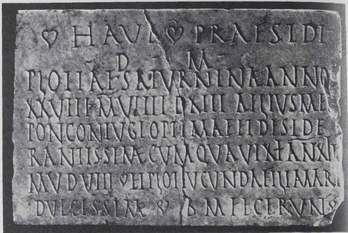
Fig. 360. — Tarragona. Taula de marbre amb inscripció (n.º 35 de P. Beltran)